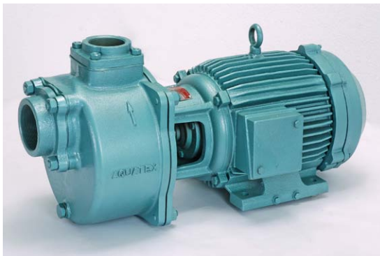
Aquasub 'AQUATEX' 원심 펌프 장치