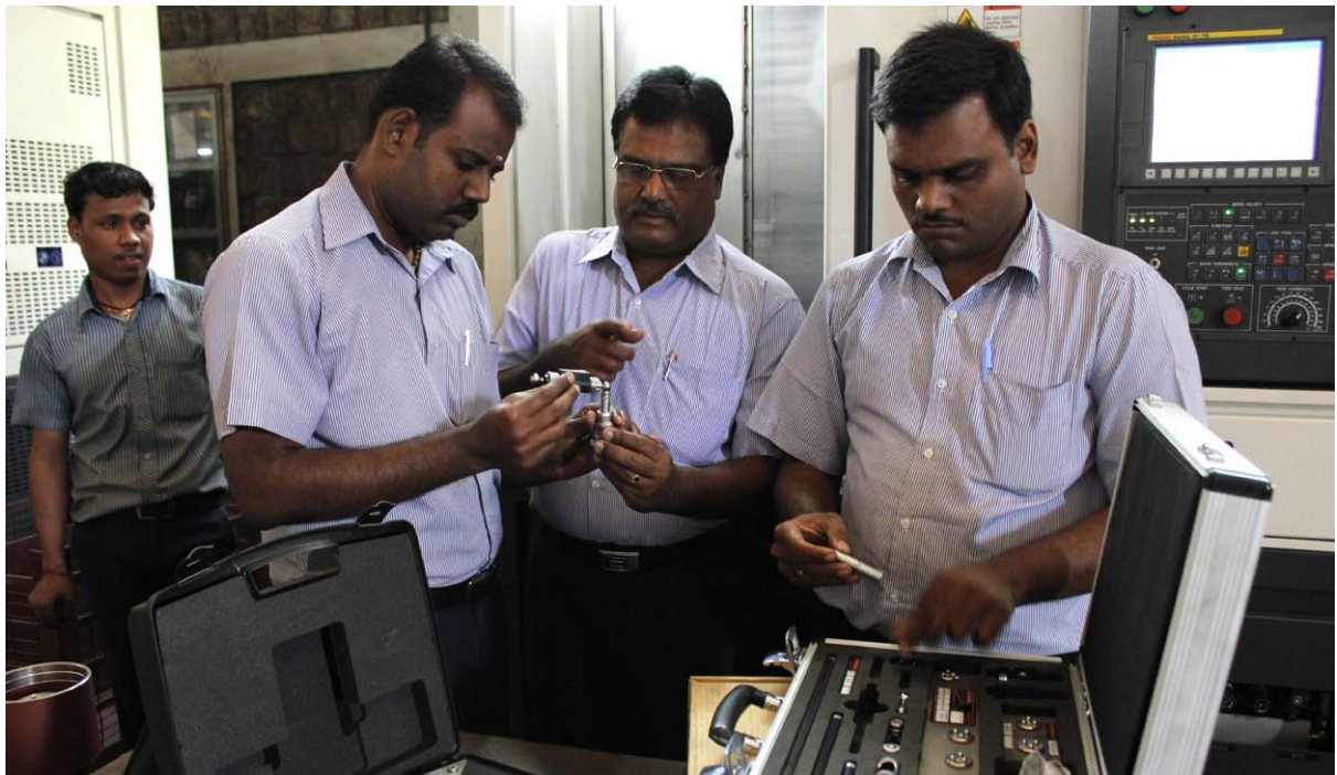
QC20-W 볼바 시스템을 검토하는 Aquasub 고위 간부와 기관장