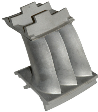
Paletta AEREO – EMA